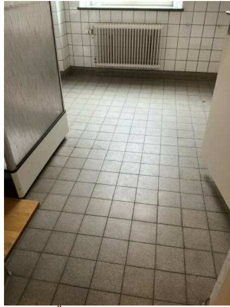
Figur 14. Äldre kakel och klinker i våtrum, 2 rum på plan 1 och 2 rum på plan 2.