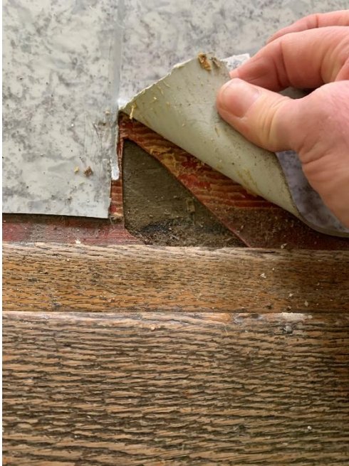
Figur 12. Underliggande plastmatta i rum 213 innehåller asbest.