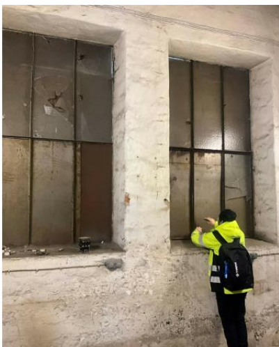
Figur 7. Fönsterkitt i elcentral innehåller asbest.