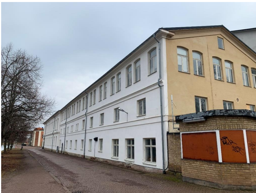
Figur 15. Hus B västra fasaden mot kanalen. I bakgrunden ansluter hus B till hus A.