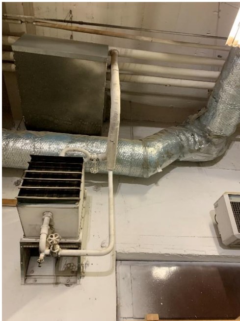
Figur 21. Rörböjar och t-kopplingar som antas innehålla asbest.

I båtbyggarlokalen förekommer rörböjar och t-kopplingar på rörisolering som antas innehålla asbest (ID:29 i bilaga 1). Dessa kunde inte provtas då de satt uppe vid tak.