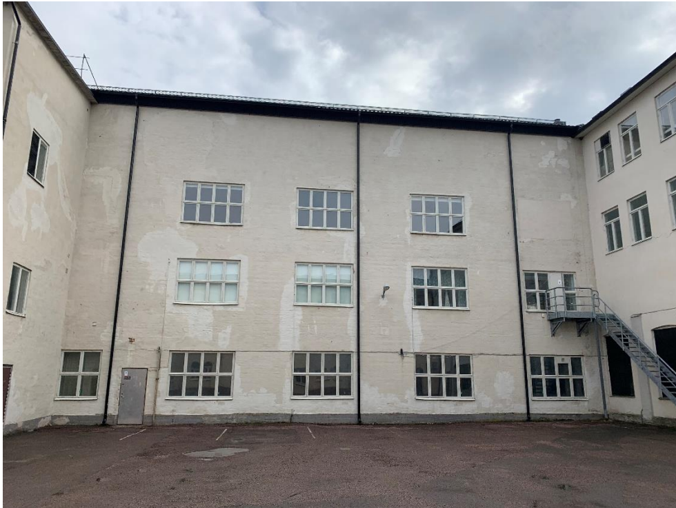
Figur 22. Fasad mot väster och gårdssidan.

Hus D har fasad mot innergården västerut, i övrigt är byggnaden integrerad i Plåtverkstaden. Den är i tre plan. I byggnaden finns verksamheter som Motala skyttegille, musikstudios och Bona Folkhögskolas teaterlokaler.