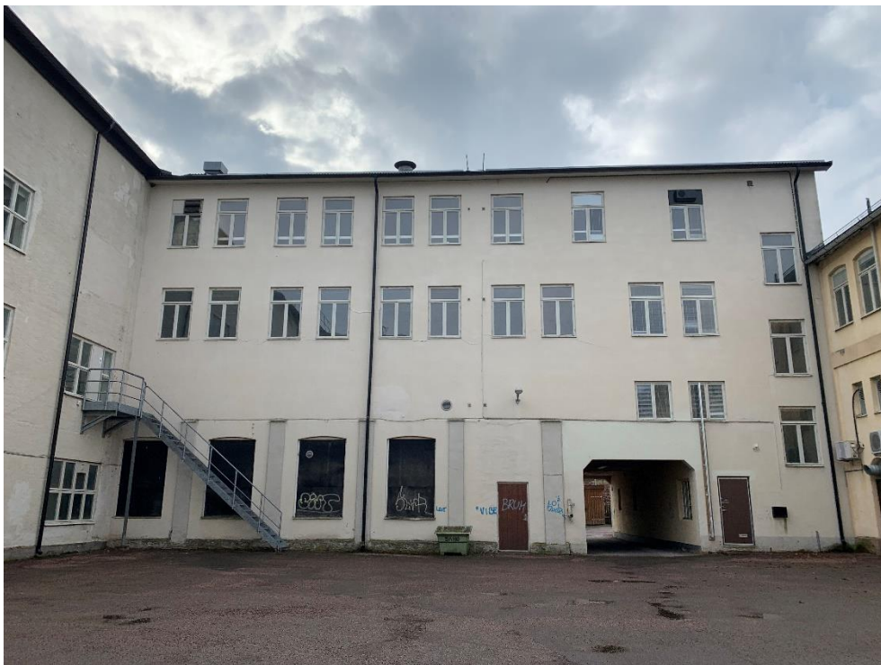
Figur 19. Norra fasaden mot gårdssidan.