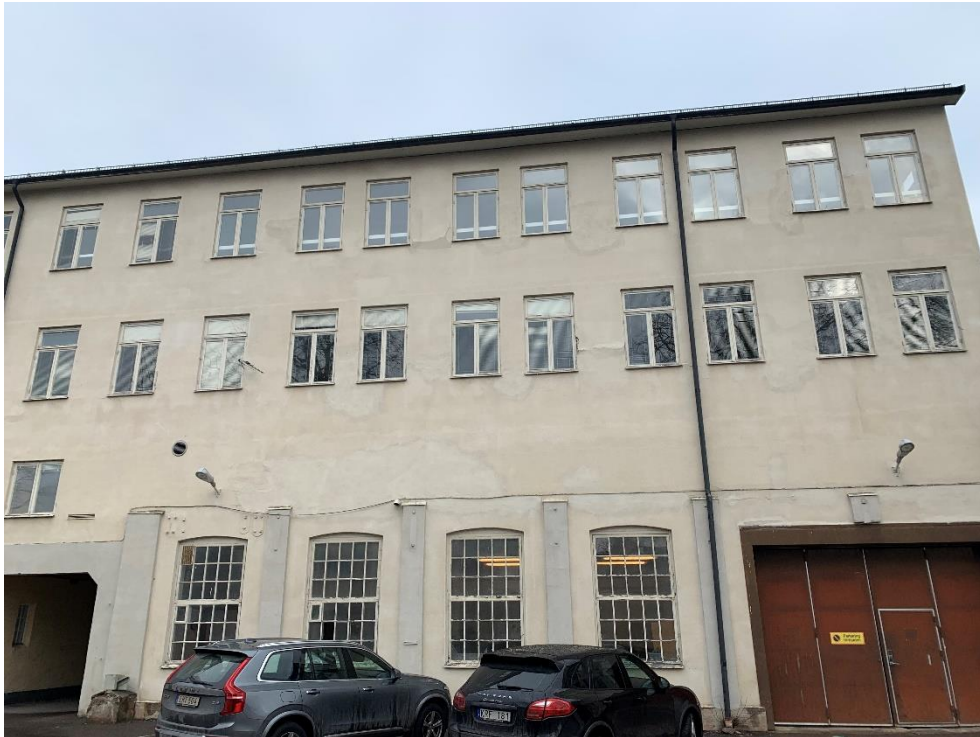
Figur 18. Hus C södra fasaden.