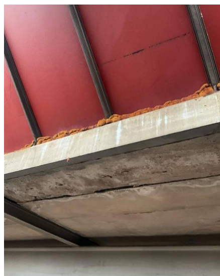
Figur 9. Fogskum vid taklanternin.