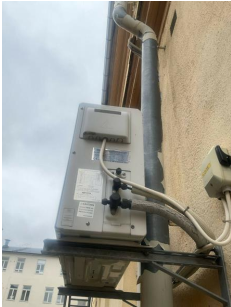
Figur 13. Luftvärmepump med köldmedium.