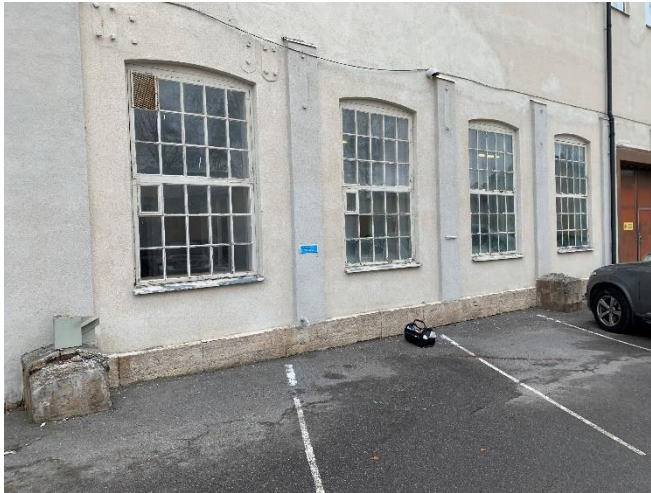
Figur 20. Fönsterkitt med höga blyhalter på södra fasaden.