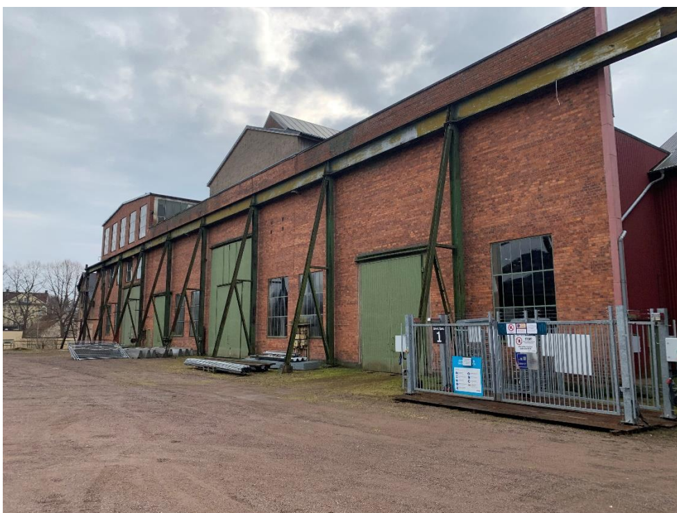
Figur 3. Plåtverkstaden utvändigt.

Plåtverkstaden är ca 10 000 m 2 stor, troligtvis uppförd på 1800-talet och påbyggd i omgångar. Uppbyggnaden är en stålkonstruktion med betongplatta som grund. Taket är klätt med takpapp och plåt på vissa ställen.