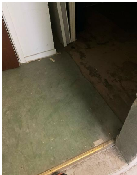
Figur 17. Äldre löslagd plastmatta i teknikutrymmen innehåller asbest.

matta som återanvänts i dessa rum, då den ligger lös på golven. Uppskattad area på mattan är ca 15 m 2 . Det kan inte uteslutas att äldre mattor finns under de nyare ytskikten.