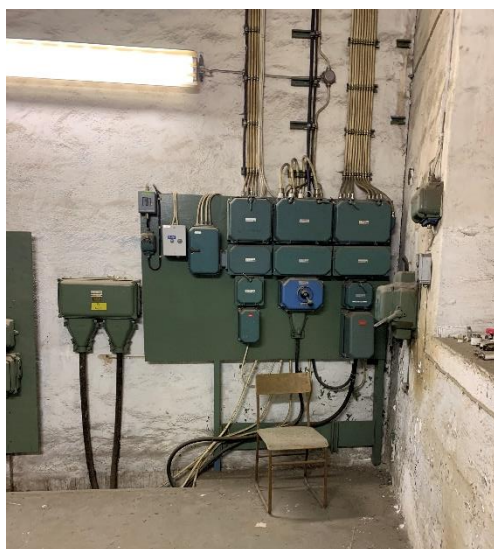
Figur 8. Elcentral med komponenter och kablar.

Eventuellt förekommer denna typ av tätning även på takfönster i hallen (för högt för en saxlift att nå upp). Fogskummet misstänks innehålla CFC och icocyanater och ska vid rivning klassas som farligt avfall, avfallskod: 17 06 03*.