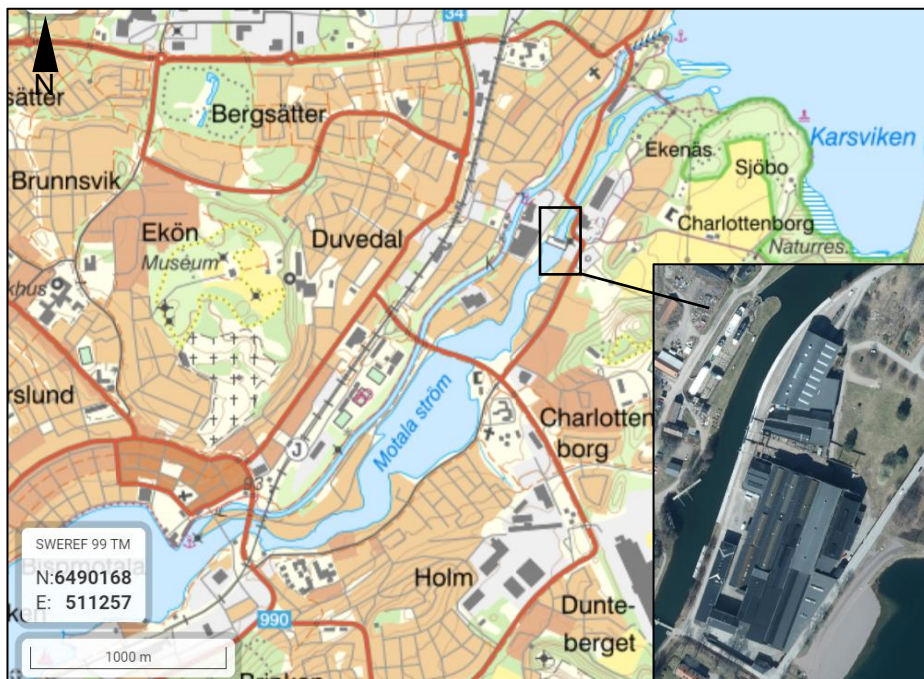
Figur 1. Motala Gamla Verkstad lokaliserat på Verkstadsön i Motala.

Serneke vill utreda möjligheterna att utveckla byggnadsbeståndet på Verkstadsön i Motala (Figur 1).