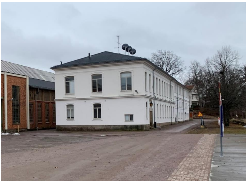
Figur 11. Hus A fasad mot norr och väster.