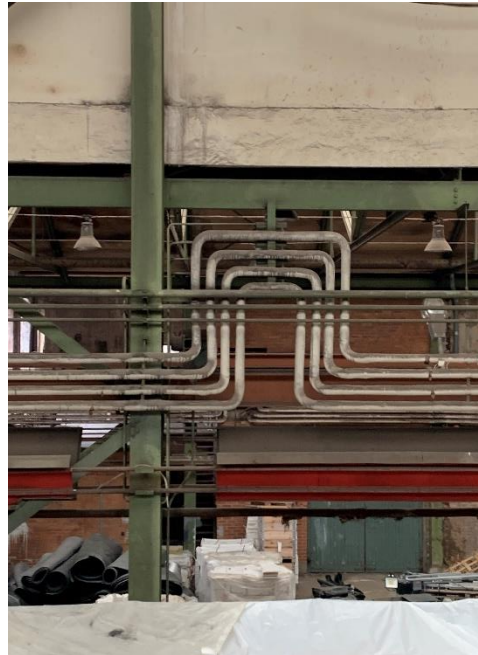
Figur 6. Rörisolering på värmerör löper utmed pelarsystemet i hela plåtverkstaden. Samtliga böjar, ändstycken och t-kopplingar bedöms innehålla asbest.