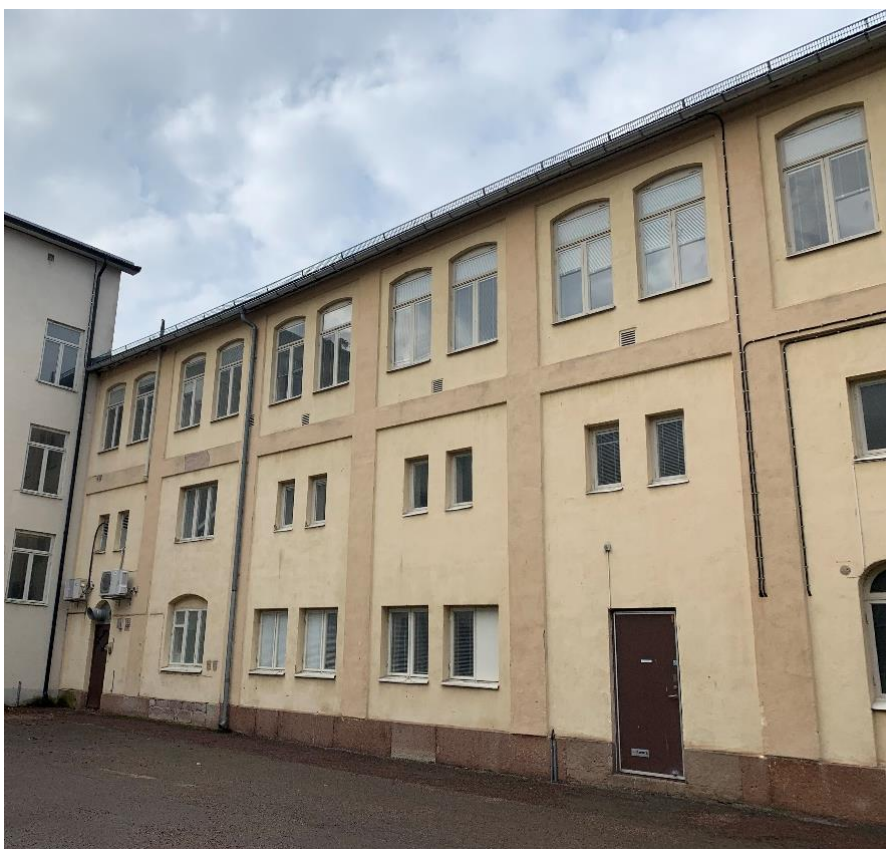
Figur 16. Gårdsfasaden av hus B, som ansluter till hus C.