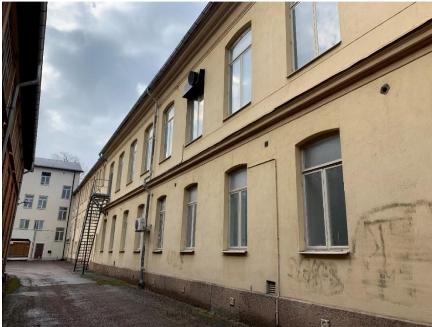
Figur 10. Hus A östra fasaden mot gårdssidan. Vid brandtrappan gränsar det till hus B.

Hus A har två plan och nyttjas för café- och uthyrningsverksamhet kopplat till Göta kanal.