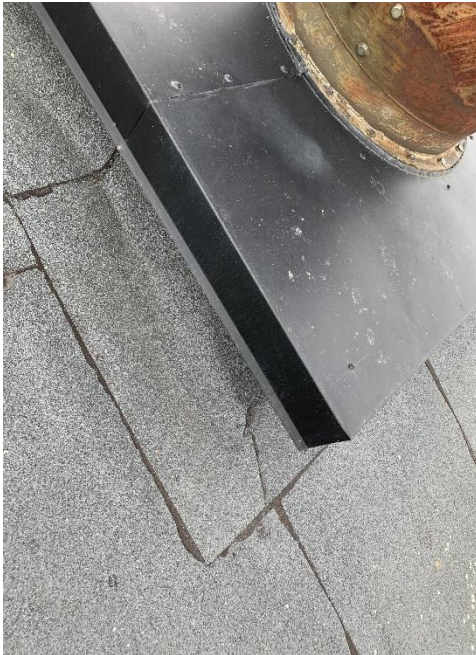
Figur 5. Den underliggande takpappen som innehåller asbest kan ses under venthuvar. Den övre synliga pappen är inte farligt avfall.

Den understa äldre takpappen på den högsta delen av taket innehåller asbest. Troligtvis finns den äldre pappen kvar underliggande på hela taket. Den uppskattade ytan av taket är ca 10 000 m 2 .