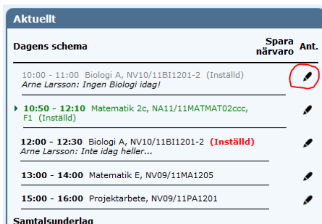
Bild 4. Klicka på pennan för att komma till sidan "Lektionsmeddelanden".

I aktuellt-rutan syns det om lektionen är inställd (röd text för framtida lektion) Även eventuellt skickat meddelande och avsändare visas.