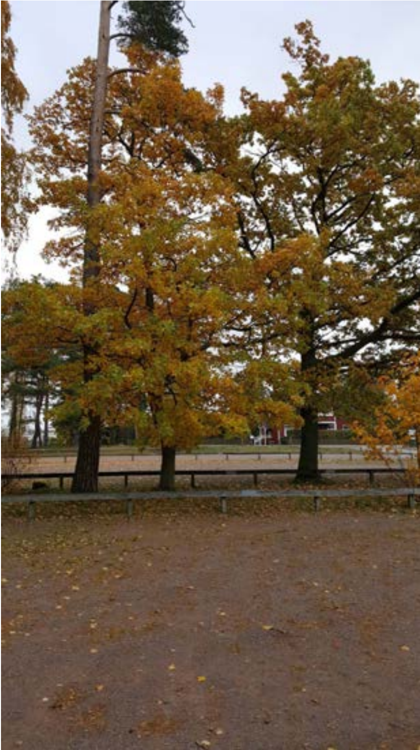
3-2: Tall och ek i mellanrummet mellan grusparkeringsytorna.