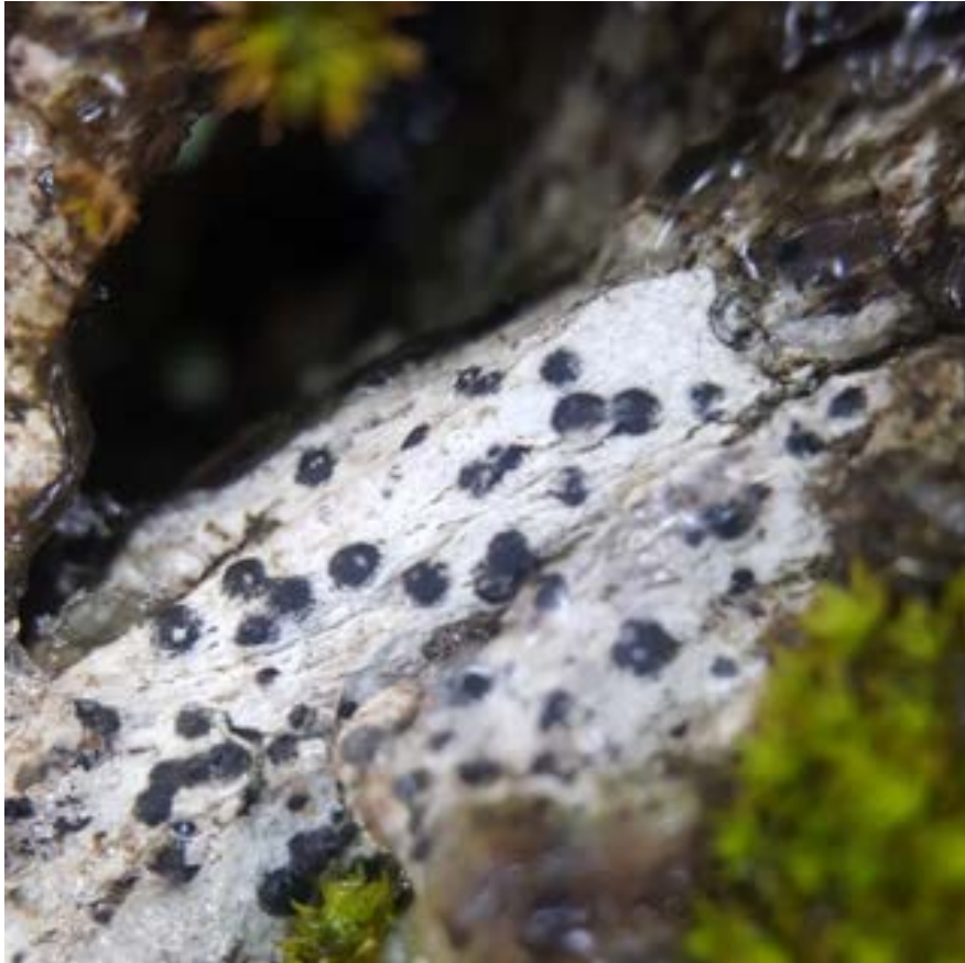
14-3: Grå punktlav, en före detta signalart. (Troligen borttagen från signalartslistan på grund av svåra förväxlingsarter men signalerar fortfarande fina naturmiljöer.)