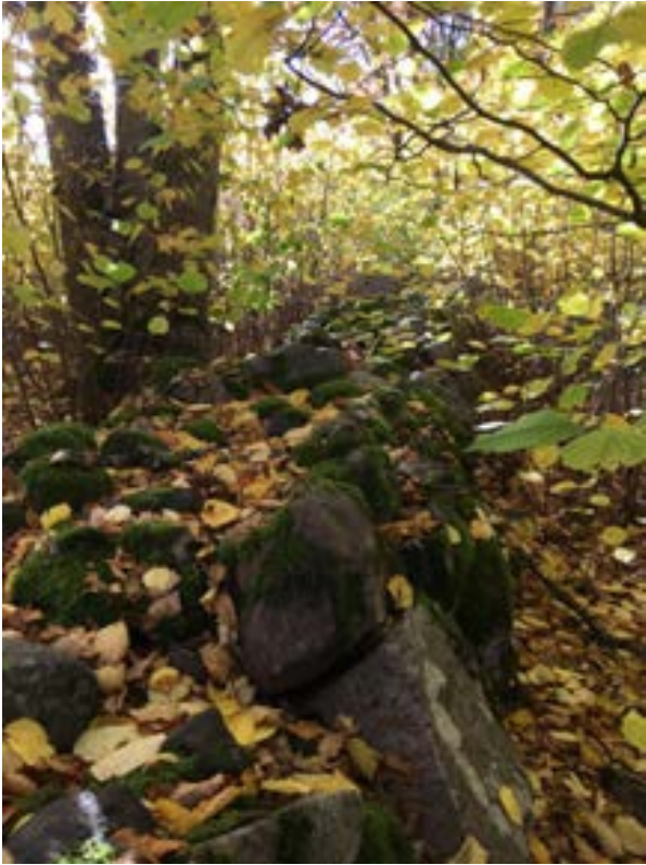
8-1: Stengårdensgården som sträcker sig från norr till söder i området.