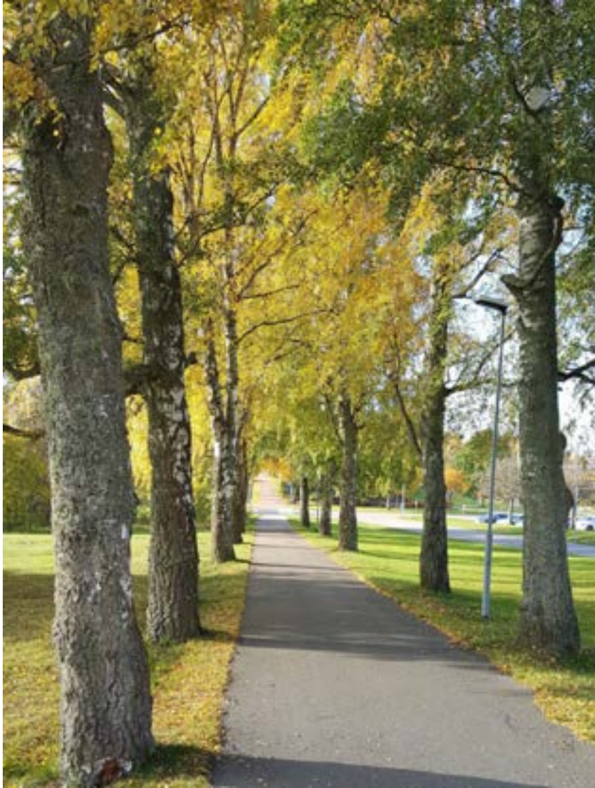
9-1: Björkallén söder om parkeringen.