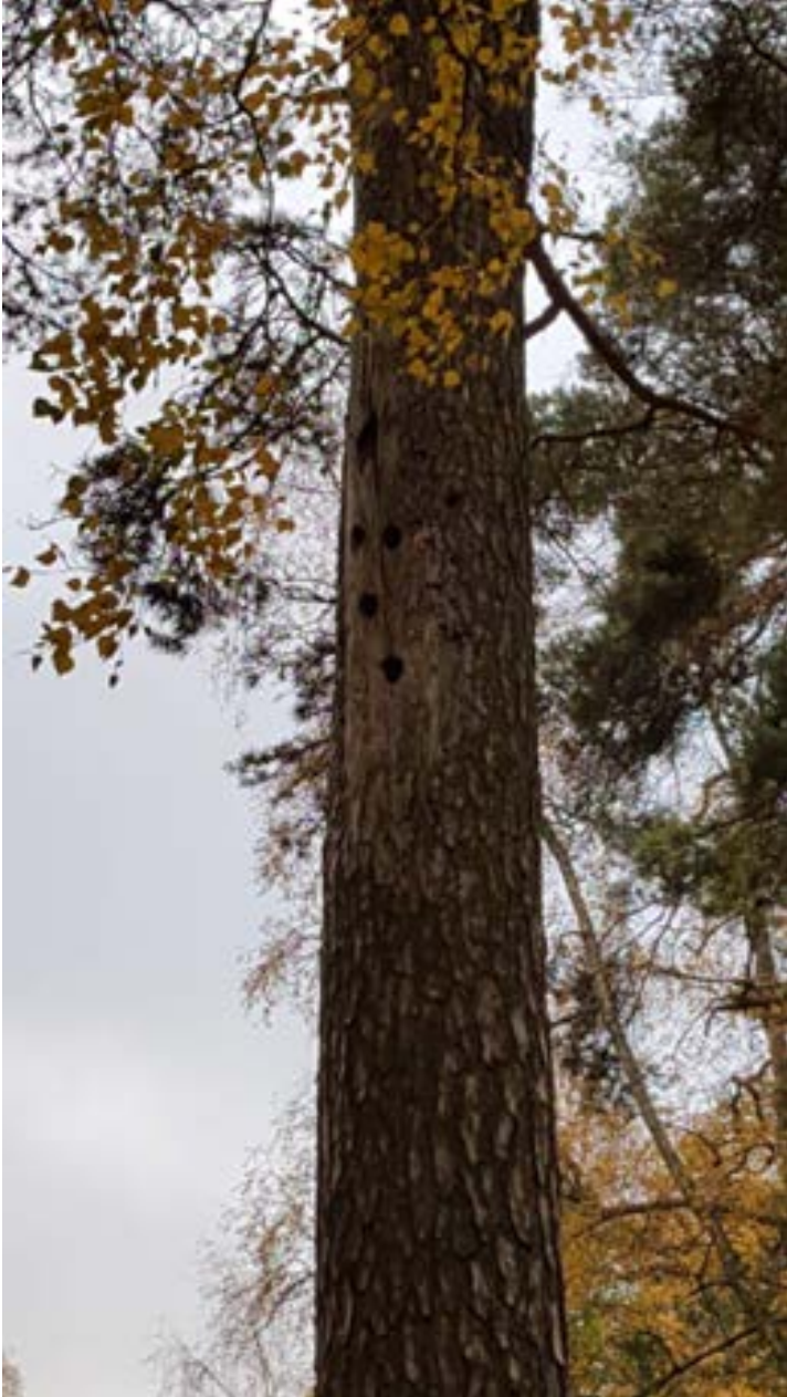
1-3: Bohål i gammal talltorraka.