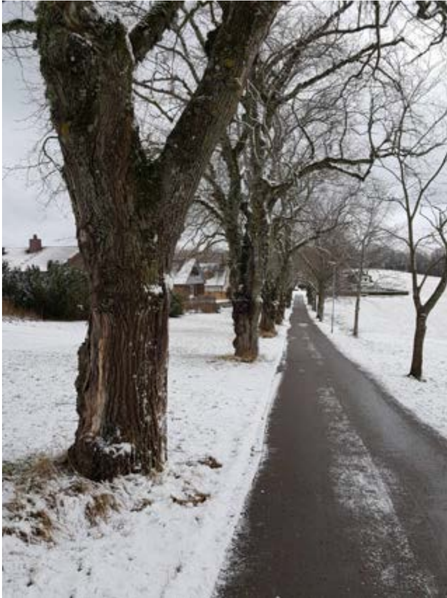
14-2: Allén med grov alm i förgrunden.