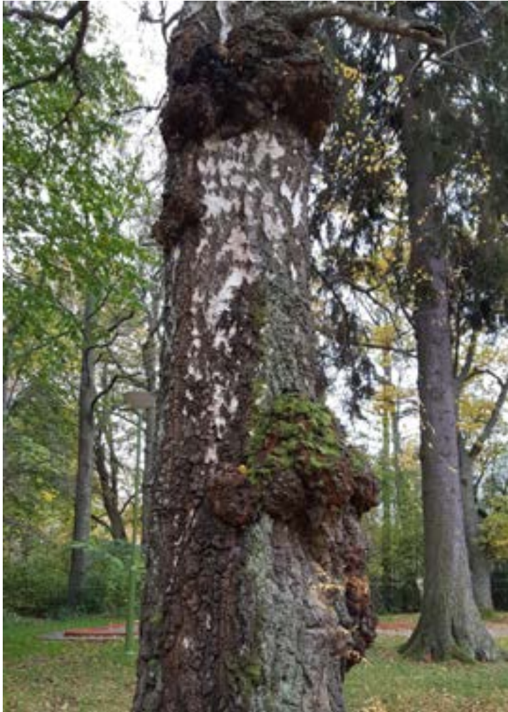
5-4: Grov björk med flertalet vrilar.