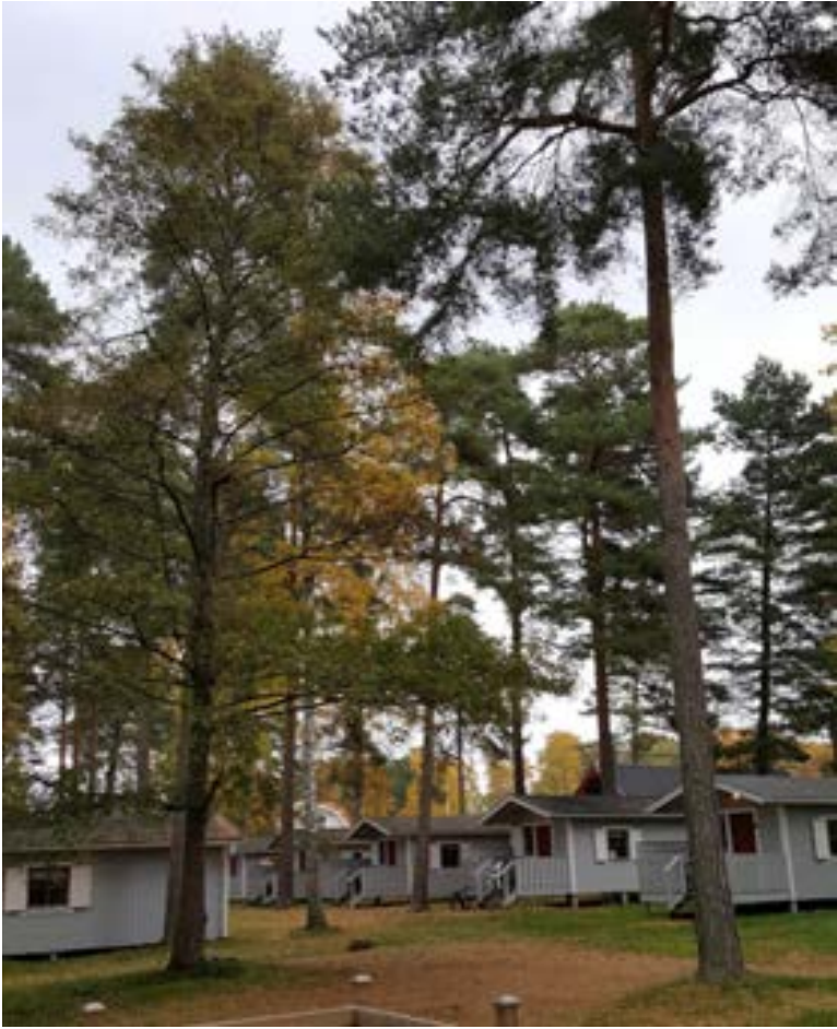
4-2: Bild på stugbyn med grov klibbal och tall i förgrunden.