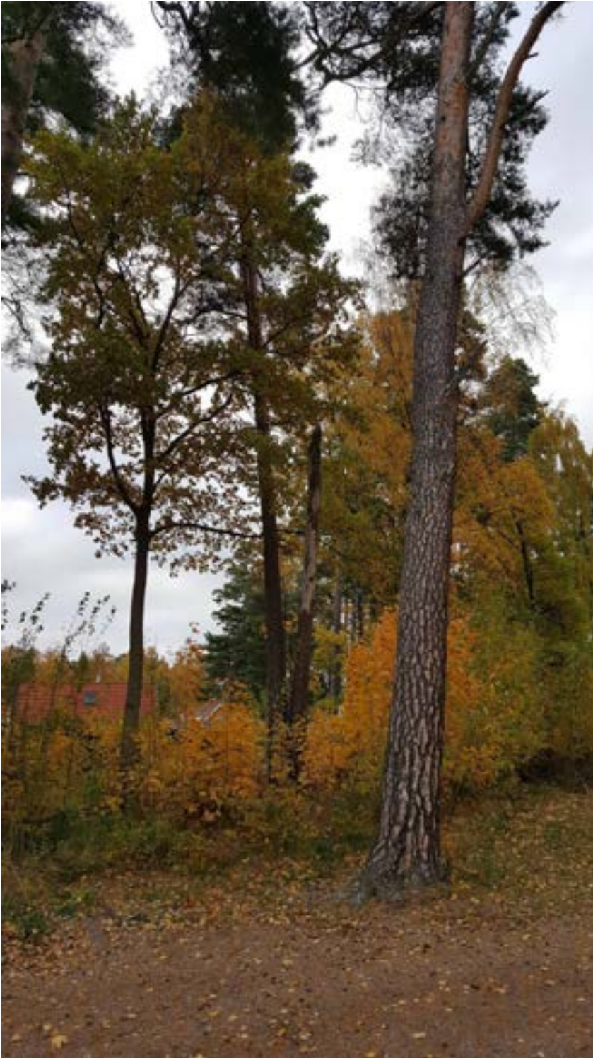
3-1: Tall i kanten mot grusparkering. Torraka syns i bakgrunden.