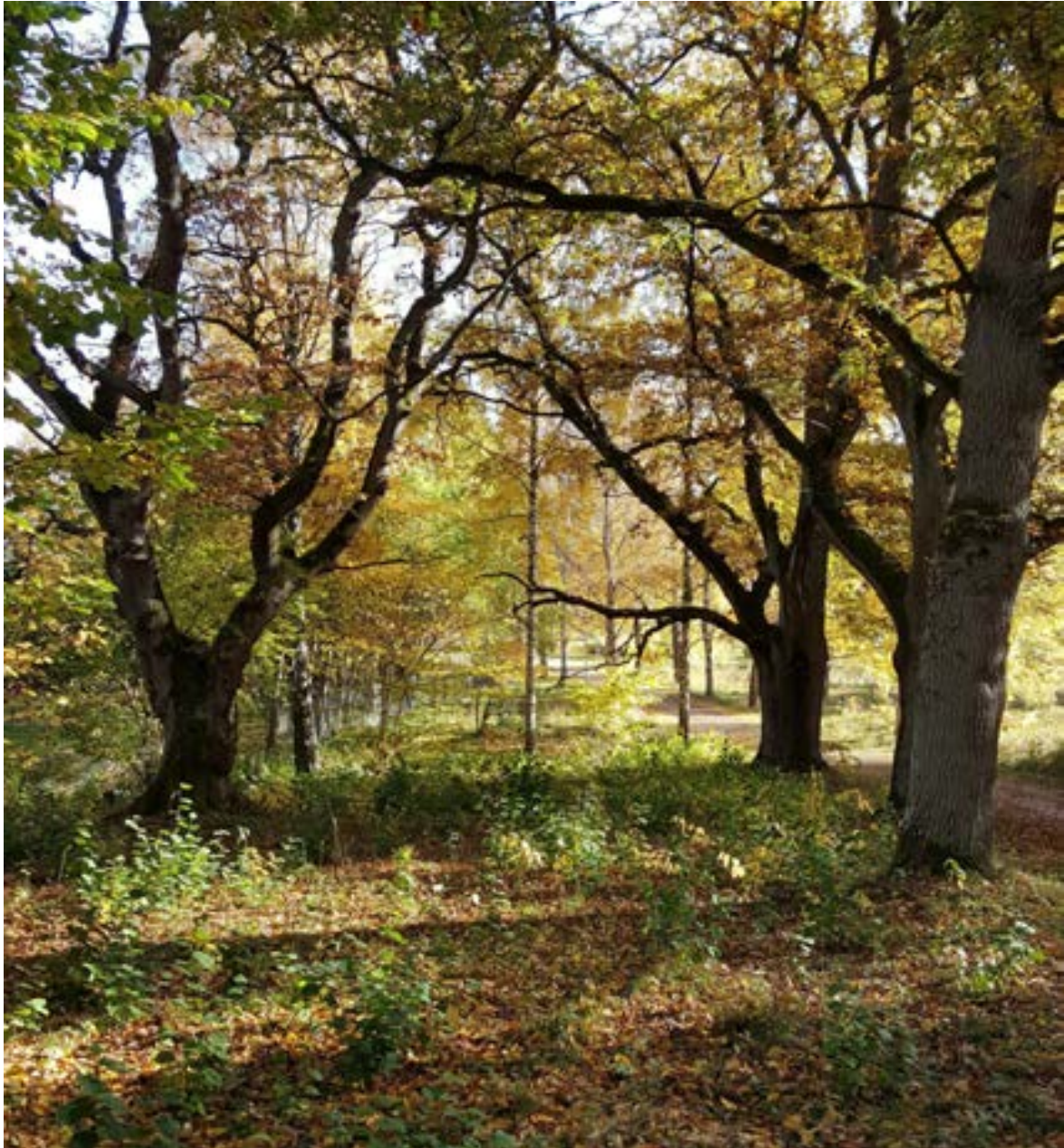
12-2: Lundmiljö med grova ekar.