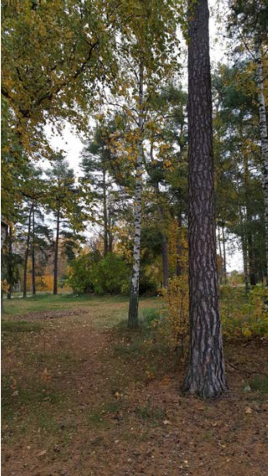
3-3: Öppen gräsyta som ibland använts som parkering.