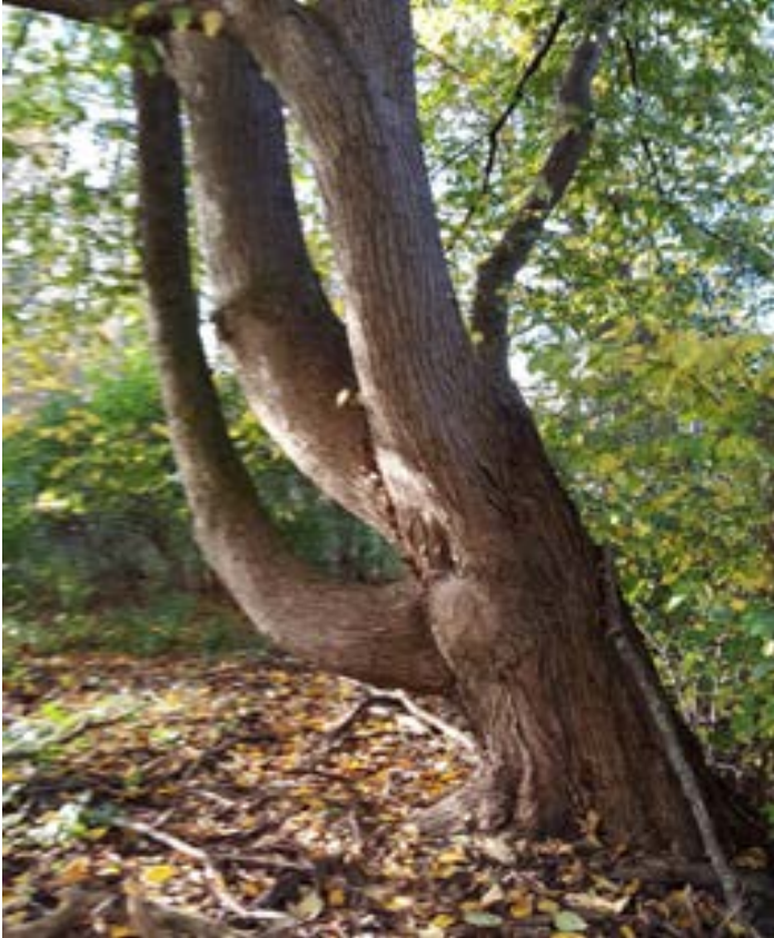
7-1: Gammal lönn med träd-porella och kornskruvmossa.