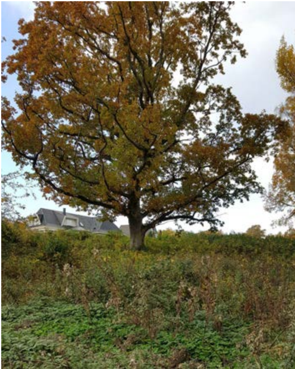
13-1: Medelgrov ek längst upp i slänten mot åkern.