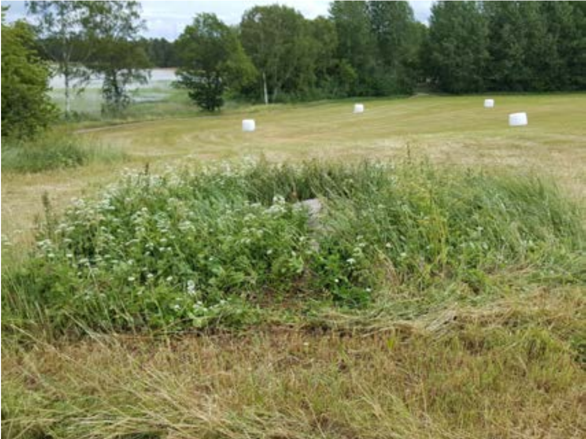
15-1: Odlingsröset med ett av de större blocken som syns.