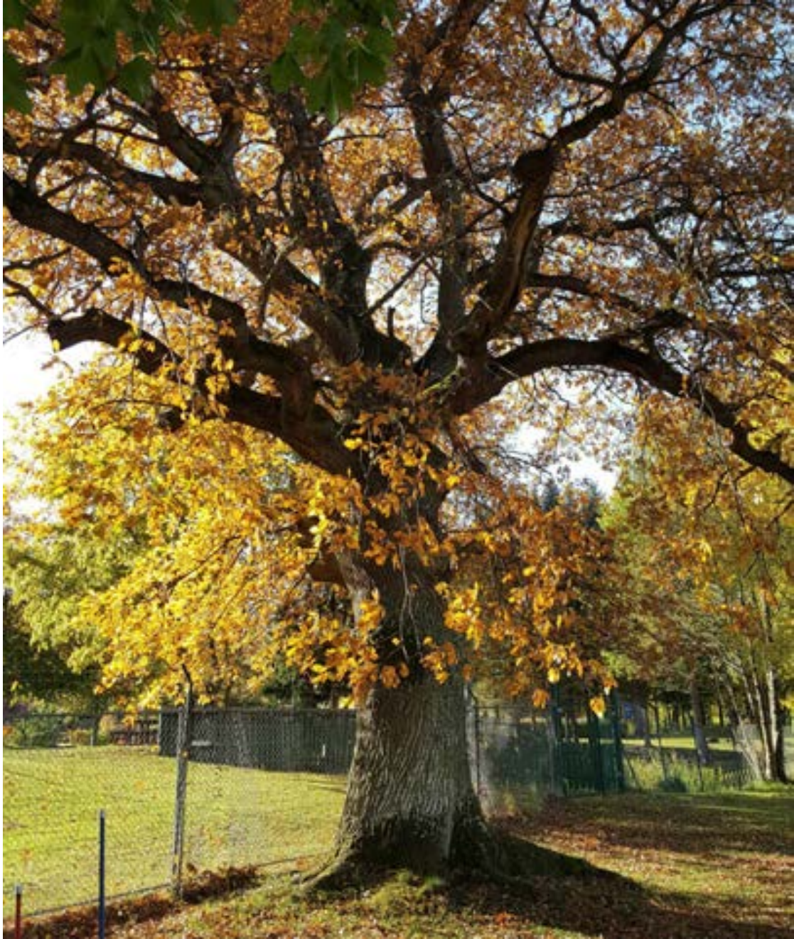
10-2: En av de större ekarna som finns på lokalen med en diameter över 4 meter.