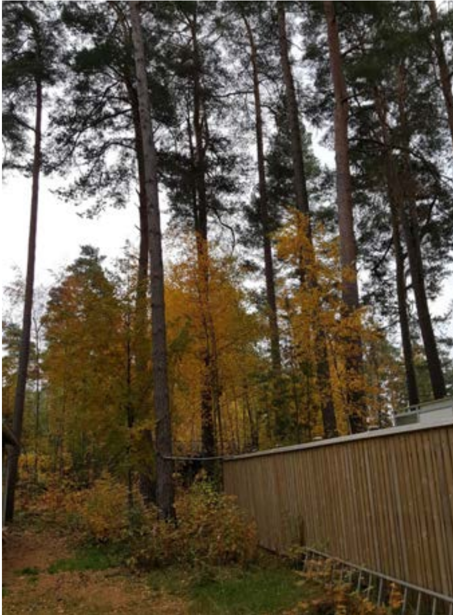
4-1: I bakkant på området finns det högväxt sly av björk.