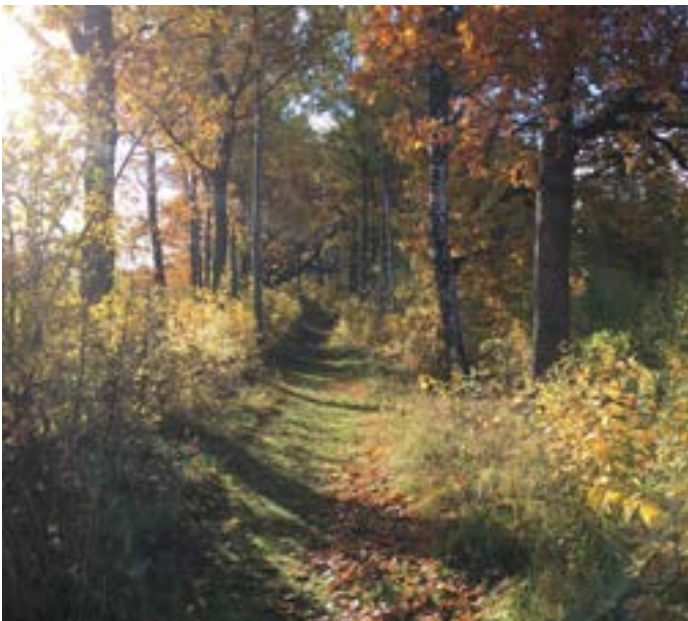
8-2: En stig löper utefter stengärdesgården.