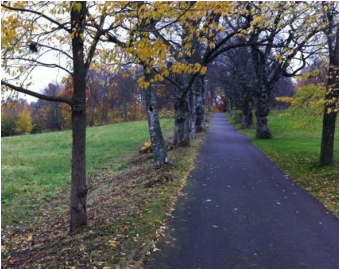
14-1: Allén med ekområdet (objekt 12) i bakgrunden. Bohål och flera grova almar syns.