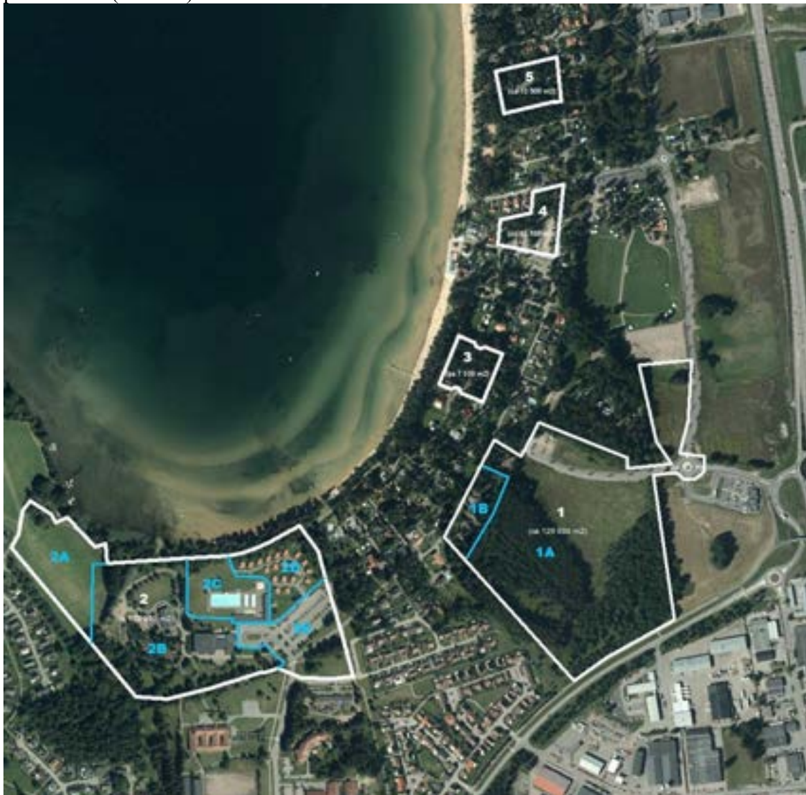
Preliminär planskiss för Lalandia

Inventeringsområdet begränsades av utredningsområdets gränser från den preliminära planskissen (se karta).