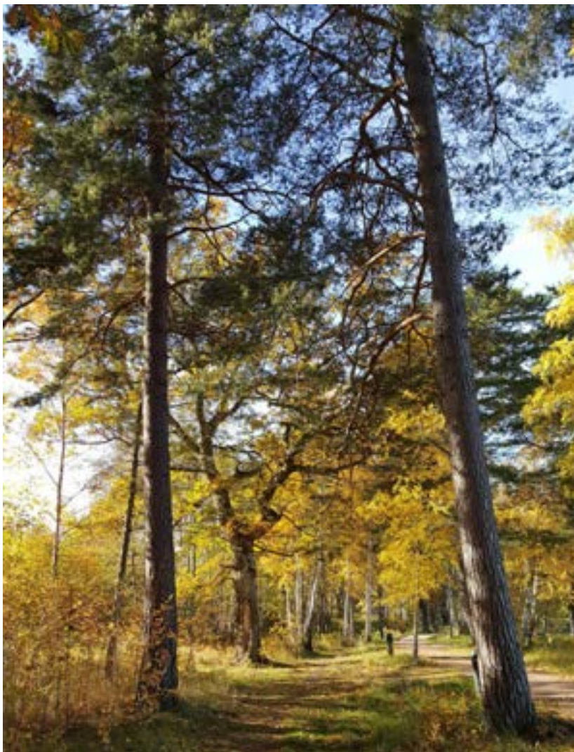
10-1: Stigen som går längst stranden kantas av många, grova tallar.