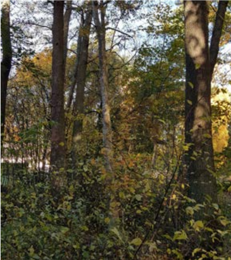
7-2: Grova klubbalar.