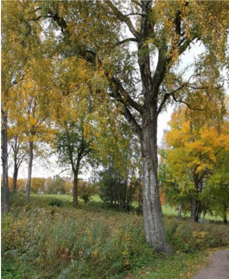
13-2: Grov björk invid gångstråket intill tomtmarken.