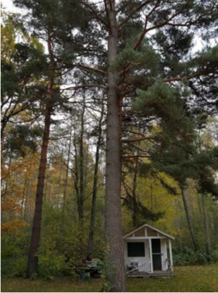
5-2: Grov tall.