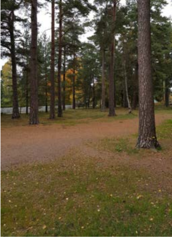
5-1: Parkeringsyta mellan grova tallar.