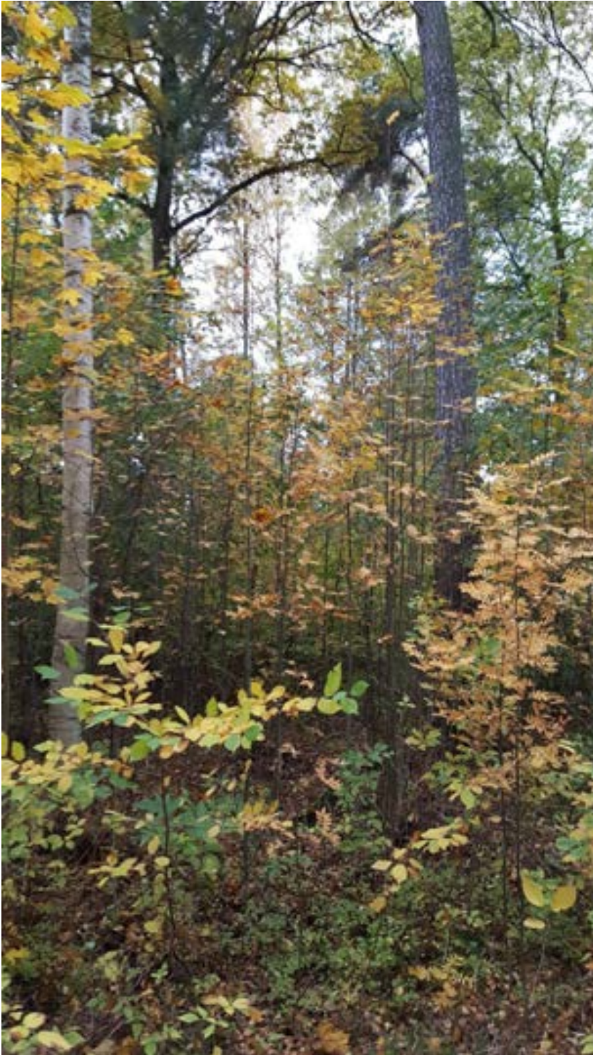
1-1: Stort slyuppslag mellan tallar och ekar.