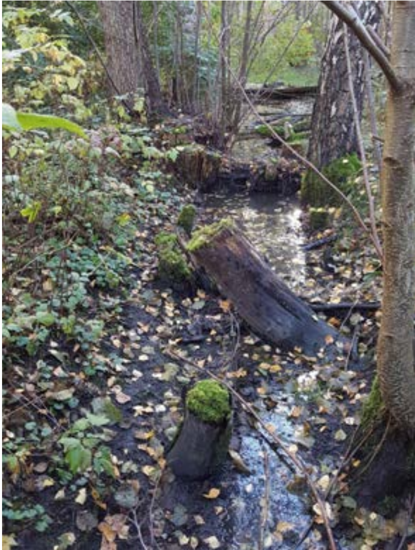
8-1: Diket som går genom hela sumpskogen har relativt mycket död ved.