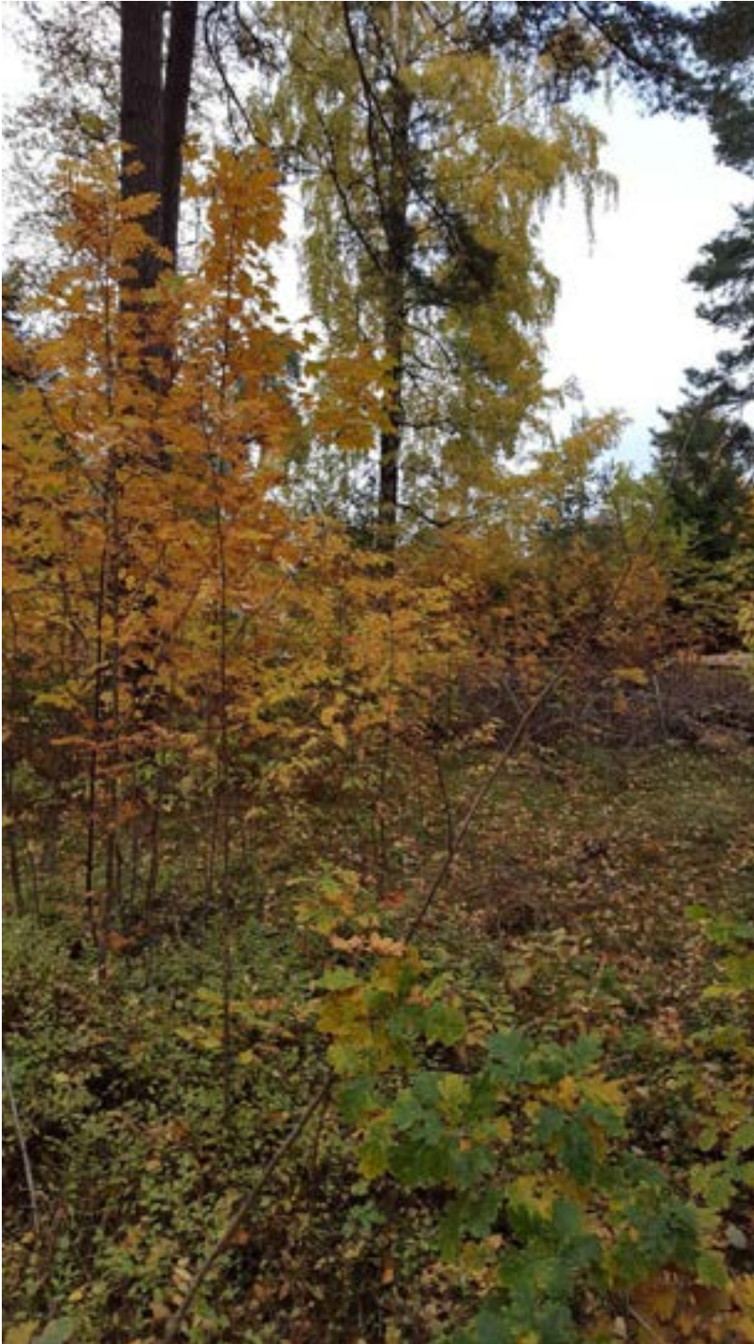
1-2: Stor föryngring av rönn och ek.