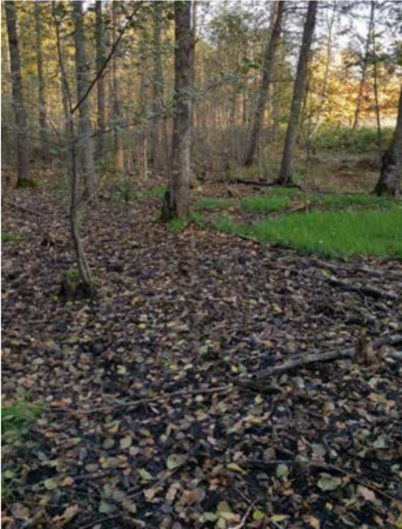
8-2: Sumpmarken med klibbalar. I bakgrunden till höger syns stora mängder säv.