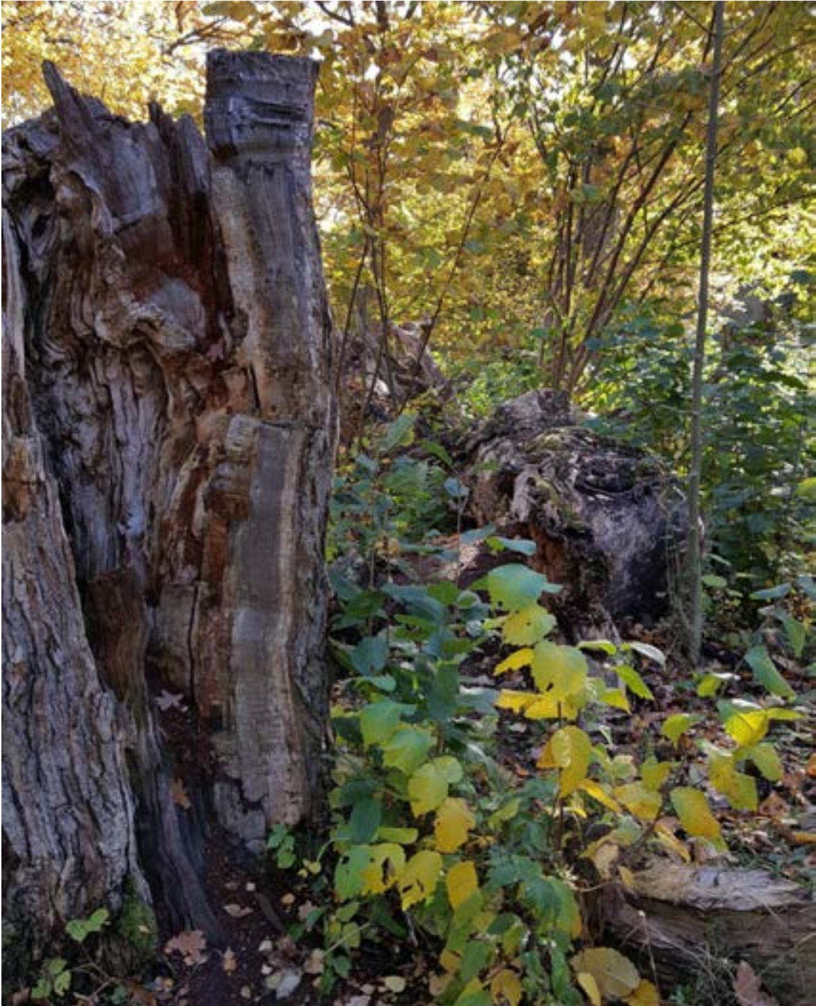
12-1: Stor ihålig, fallen ek.